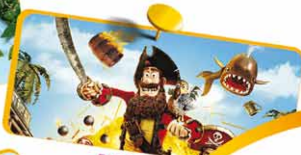
PIRACI 3D PREMIERA 13-04-2012