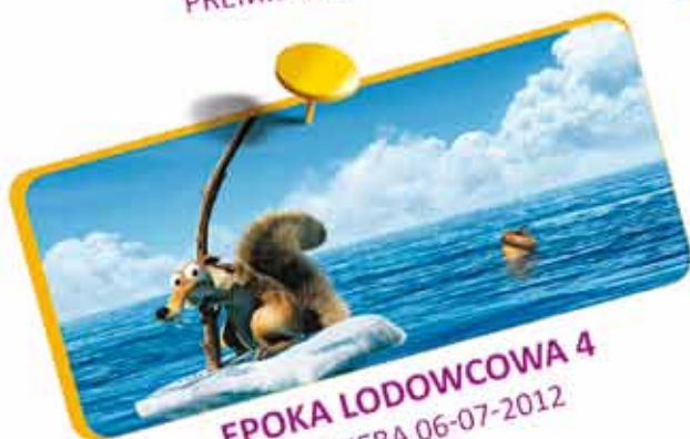
EPOKA LODOWCOWA 4 PREMIERA 06-07-2012