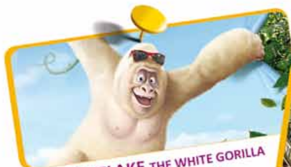
SNOWFLAKE THE WHITE GORILLA PREMIERA 18-05-2012